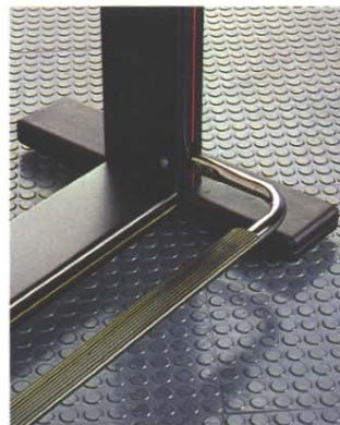
Table à dessin de haut qualité sans contre-poids. Mouvements d'inclinaison et d'élévation équilibrés avec ressorts compensés. Pédale de commande et pieds sont démontables pour réduire l'encombrement dans l'expédition. Blocage par embrayage à lamelles multiples.

Couleurs: blanc - jaune - rouge - vert - noir - gris.